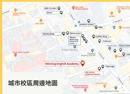
城市校區周邊地圖